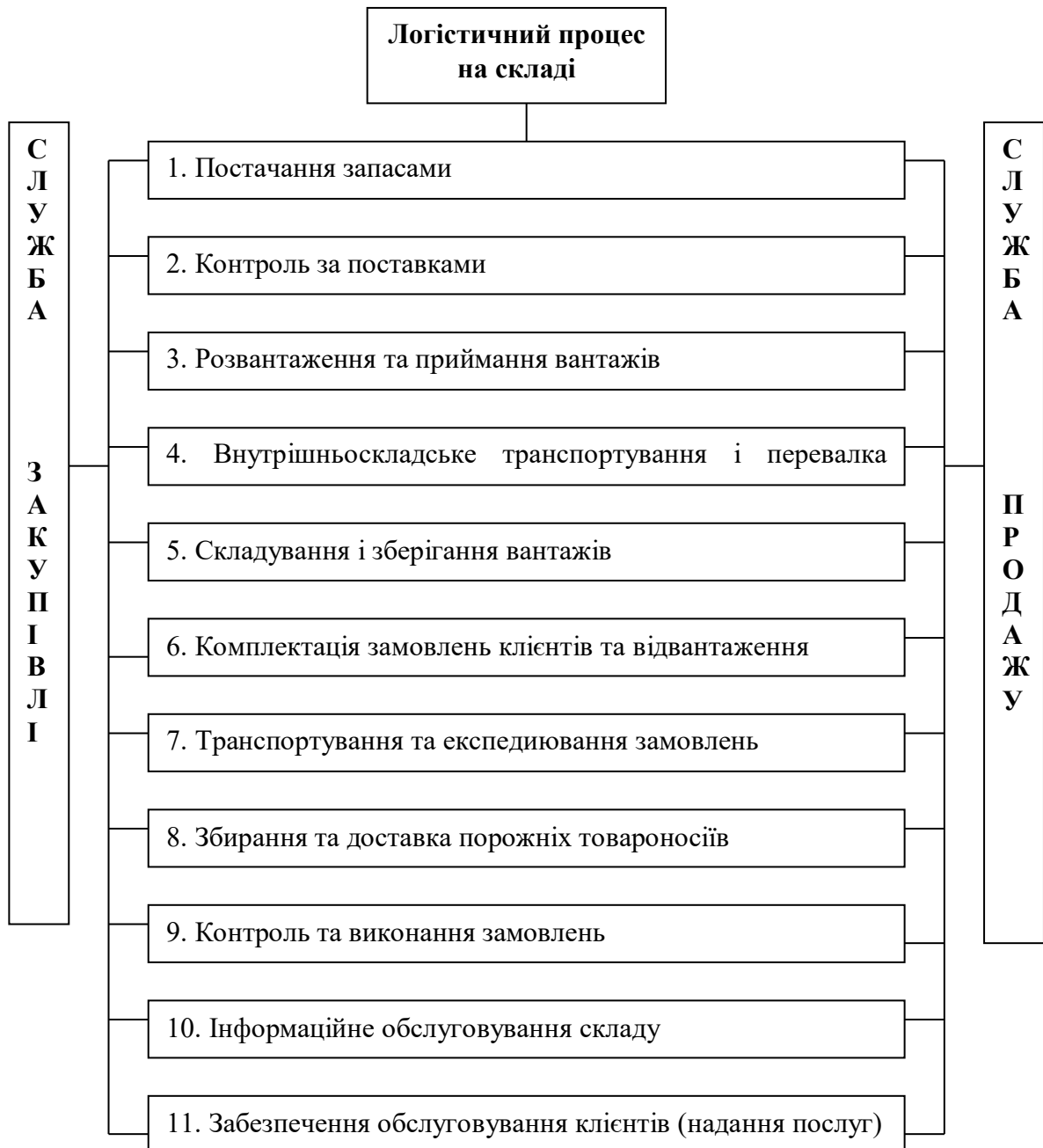
Рис. 3.4 Схема логістичного процесу