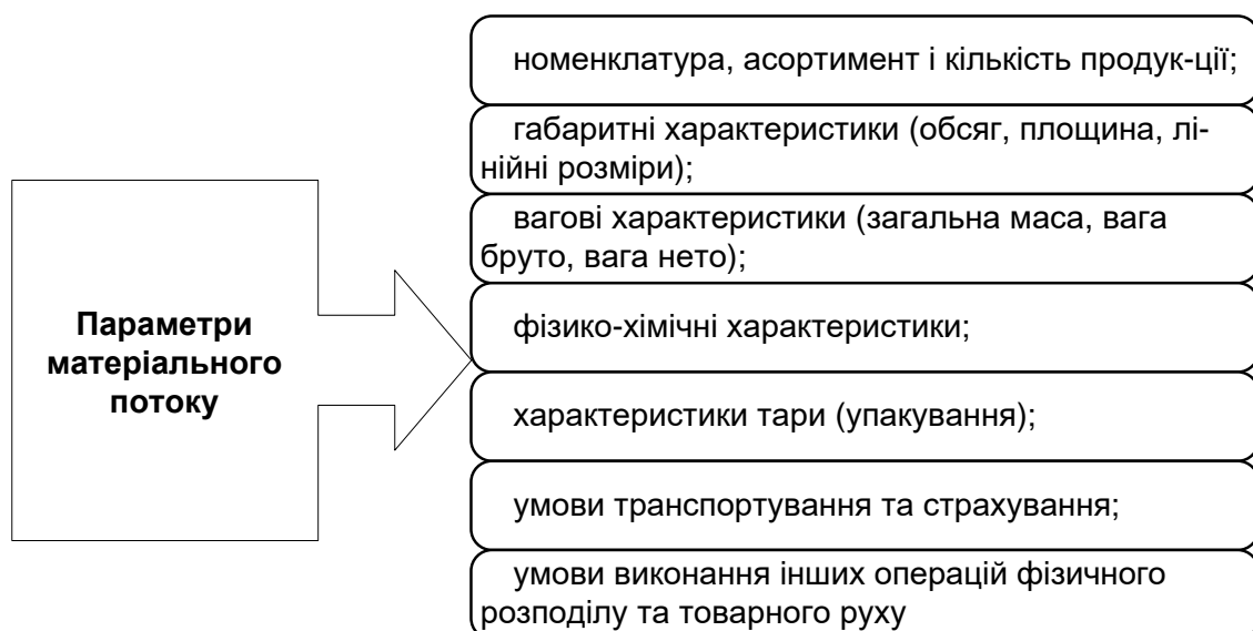
Рис. 3.1. Параметри матеріального потоку

У логістиці для управління потоками передбачається також здійснення таких функцій : планування, оперативне регулювання, облік, контроль, аналіз.