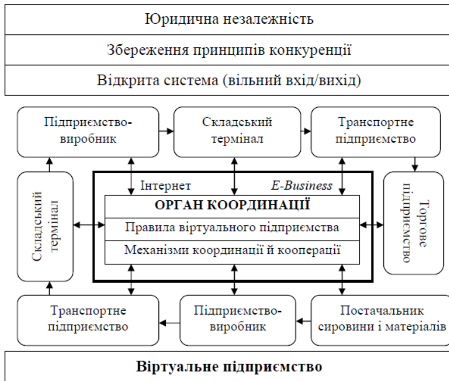
Рис. 8.2 – Загальна організаційна схема ВП

7. Виробництво – підприємство, підприємство, підприємство, підприємство, підприємство